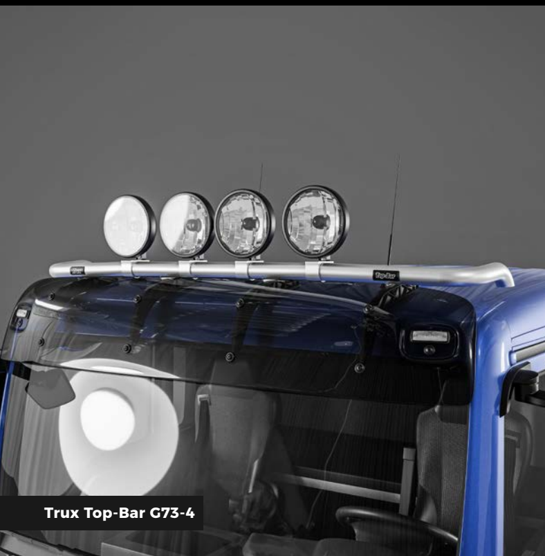
Trux Top-Bar G73-4